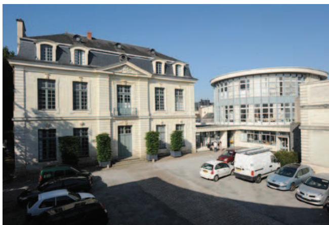
Esba TALM, site d'Angers.

La réunion des écoles de Tours, d'Angers et du Mans offre une solide formation généraliste en Art et Design et reconnue au grade de master qui se décline selon quelques orientations fortes : sculpture, conservation-restauration des œuvres sculptées, techniques textiles, design sonore, design espace de la cité et design prospectif. TALM Angers développe une politique d'ouverture sur la création contemporaine, questionnant l'histoire et l'actualité d'un monde en devenir. La pédagogie s'appuie plus précisément sur l'exposition, ainsi que sur une volonté de