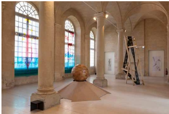
« Maelstrom », exposition des Félicités 2014 de l'ÉSAM Caen/Cherbourg, Abbaye-aux-Dames, Caen, février 2015.

Toutes les informations sur : www.esam-c2.fr