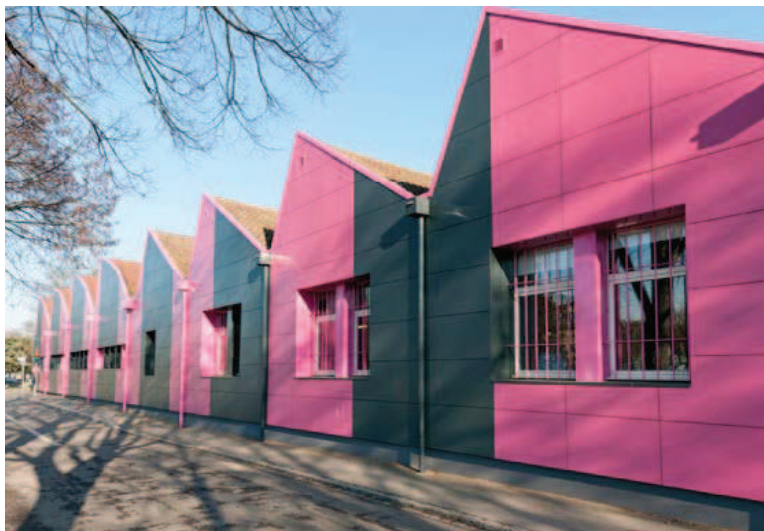
Site de la HEAR à Mulhouse.

DIPLÔMES 2016, du 24 au 26 juin à Strasbourg. www.hear.fr