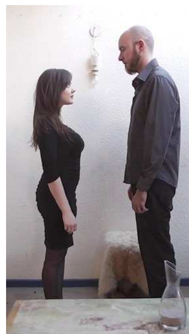
Collectif Ekphrasis.

Après deux années de recherche sur les médias et l'information, et forts d'une expérience de résidence à Calais, notre domaine de recherche s'est étendu. Peu à peu, l'écriture est venue intégrer l'espace d'exposition et se mêler aux images.