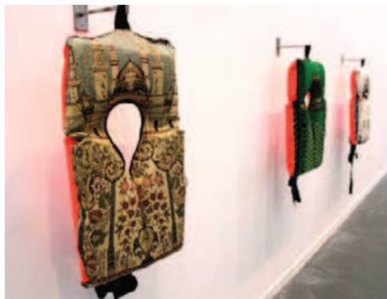
El Mehdi Largo, Brassières de sauvetage LAZIZA, 2015.