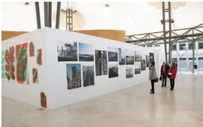
Vue de l'École Supérieure d'Art et Design •Valence.

L'École Supérieure d'Art et Design •Grenoble •Valence est répartie sur deux sites qui conservent leur caractère propre. L'ÉSAD •Valence est située aux lisières de la ville, dans un bâtiment à l'architecture audacieuse de 4 000 m 2 , qui sera complété en 2018 par une extension de 1 000 m 2 . On y enseigne l'art contemporain et le design graphique.